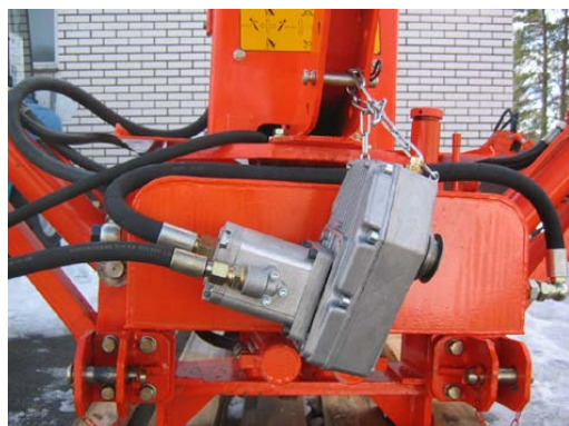
Bilden visar pumpsats för kraftuttag med växellåda