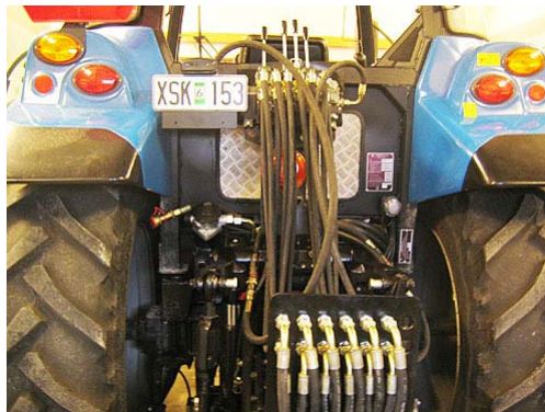
Bilden visar förlängt slangpaket för manövrering av grävaren från traktorhytten