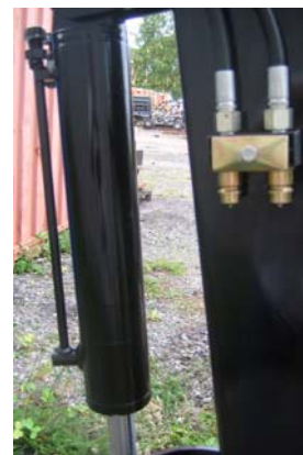
Bilden visar extra hydraultag monterat på sticka

Förlängt slangpaket för manövrering från traktorhytten. Ca.pris exkl.moms 4 500:-