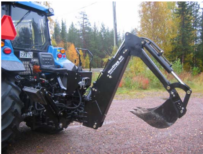
Bilden visar NorDigg 60

Slangbrottsventil för bom är standard på alla modeller, en säkerhet för dig !